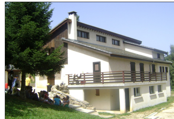
Hebergement : Chalet des scouts à Camurac