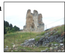
Montaillou vestige de château cathare